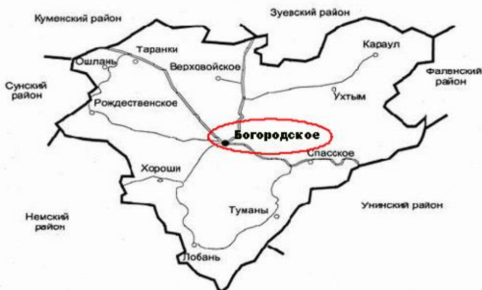
Рис. 2 – Карта Богородского района